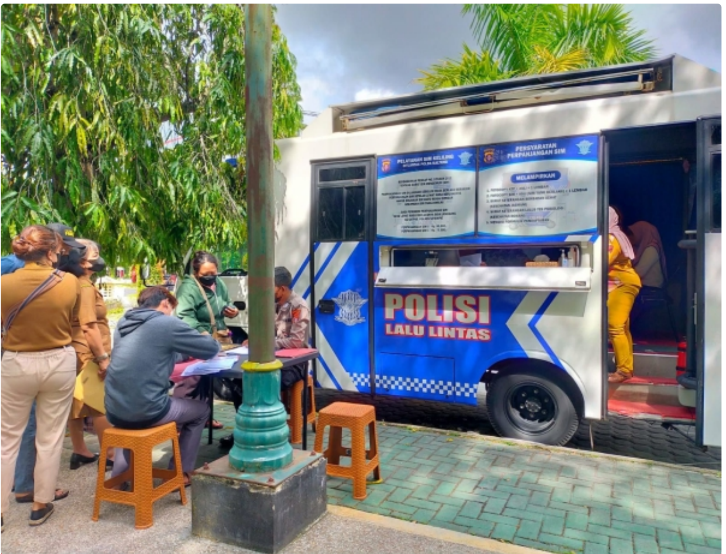
Bus Keliling Dirlantas Polda Kalteng

PALANGKA RAYA - Direktorat Lalu Lintas (Ditlantas) Polda Kalteng berikan pelayanan Surat Ijin Mengemudi (SIM) keliling bagi masyarakat Kota Palangka Raya. Selasa (6/12/2022) Pagi.